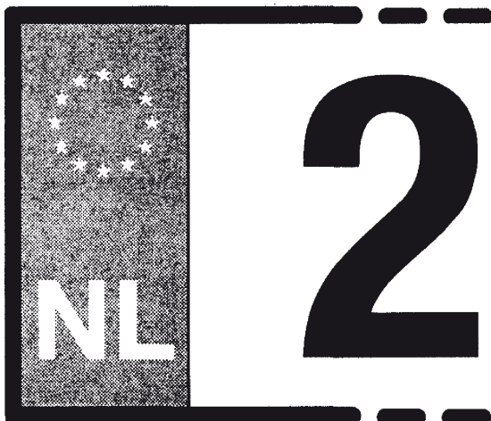
OBRAZAC 1. (primjer)